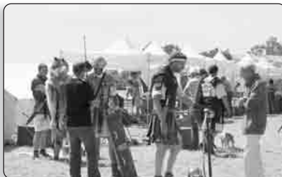
Un surprenant mélange d'époque durant ce week-end antique à Padulella