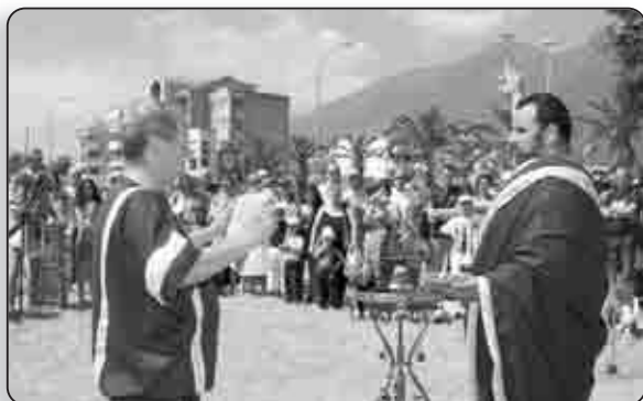
Entre démonstration et reconstitution historique pour un public conquis