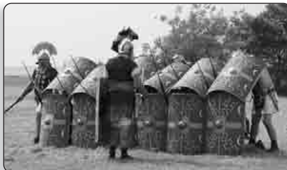
Démonstration de manœuvres de l'armée romaine