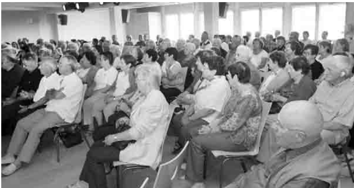
Les aînés ruraux étaient 250 rassemblés à la résidence des Isles

Tous partagent le même souci d'être utiles à leurs mandants et tous n'ont pas d'autre but que de lutter contre l'isolement, la solitude et le repli sur soi, facteurs aggravants du mal vivre et des maladies qui l'accompagnent. Ce rassemblement était l'occasion de remercier la direction et le personnel de la MSA , la Collectivité Territoriale de Corse , et la Direction de la Jeunesse et des Sports , sans oublier le village de vacances Touristra et la résidence des Isles qui a ouvert ses portes à cet événement.