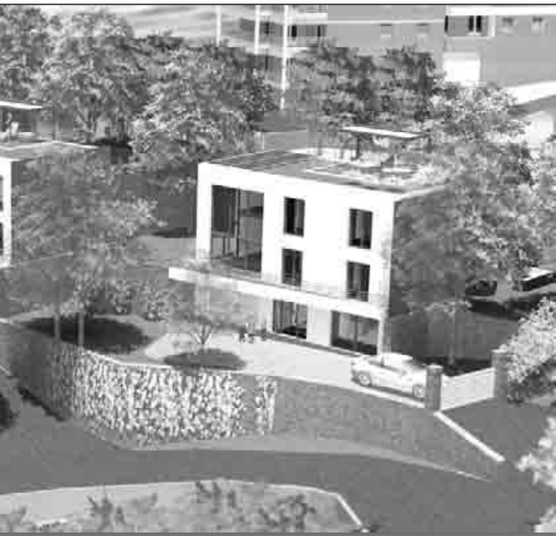
en cours de construction dans le quartier de Toga, à Bastia

F4 + studio indépendant (+ garage) composé, sur 200 m 2 habitables la première maison dans les arbres qui aura par ailleurs sa piscine vitrée hiver/été bénéficiant d'un bel ensoleillement et conçue comme un véritable SPA (avec nage à contre-courant et banc de massage).