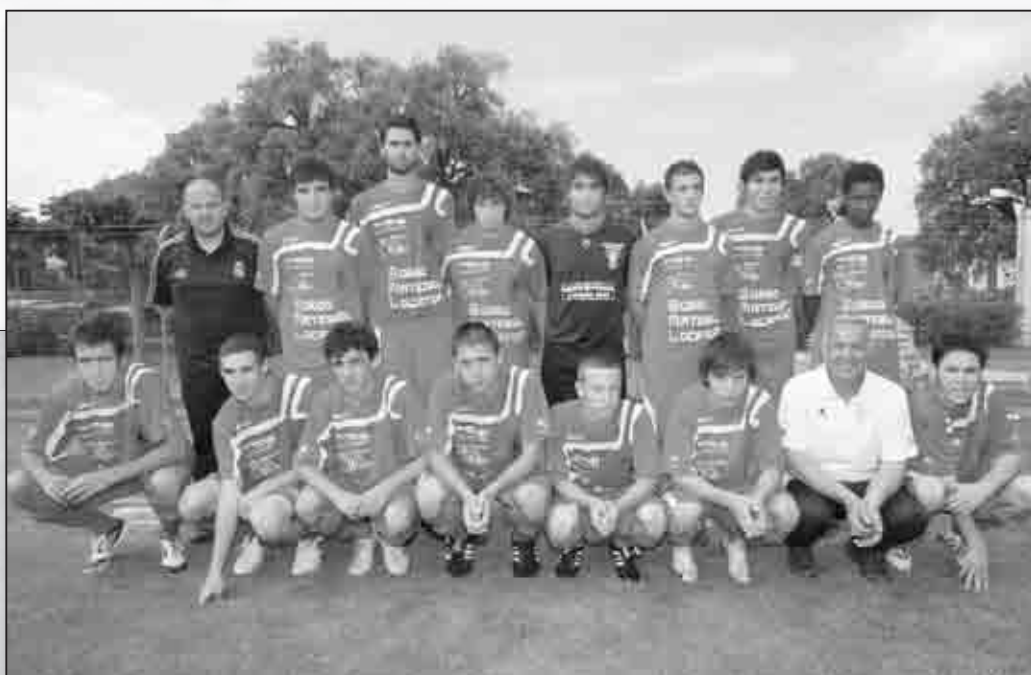
L'équipe du Gallia-Lucciana