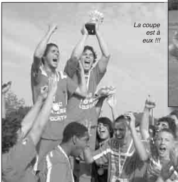
La coupe est à eux !!!

En catégorie 16 et 19 ans, la coupe de Corse est nordiste ! Le Gallia Lucciana et le SCB sont les vainqueurs de l'édition saison 2011-2012.