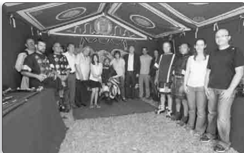
Les partenaires de l'évènement réunis autour de l'empereur Hadrien

« Padulella la romaine » a immergé le public dans ce qu'était la vie de la Légion VIII Augusta sous l'empire d' Hadrien (117-138 ap JC), ravivant des références historiques pour certains, et ouvrant l'esprit des plus jeunes à cette lointaine époque, par le biais de la valorisation des aspects culturels et linguistiques propres à la Corse en liaison directe avec la civilisation romaine antique.