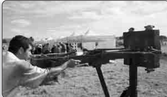
Le tir à l'arbalète

Les enfants ont été éduqués aux techniques d'attaque des romains