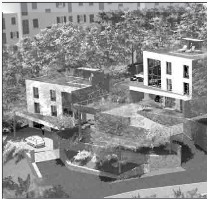
Le projet de «Les maisons dans les arbres... en ville» dont le «prototype» est en cou

Du haut de ses 9 mètres, la première « Maison dans les arbres » de Bastia a aussi été pensée pour les personnes à mobilité réduite. Une trémie a été prévue pour l'installation ultérieure, si nécessaire, d'un ascenseur.