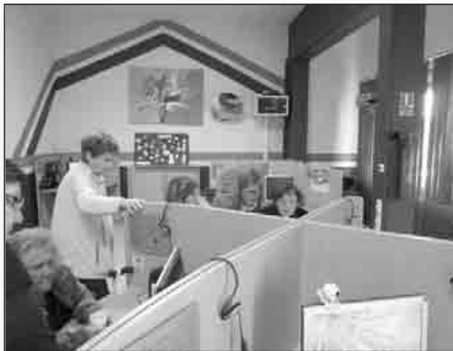
Des ateliers TIC destinés à tous publics

A noter enfin : à la suite d'un voyage en Sar-