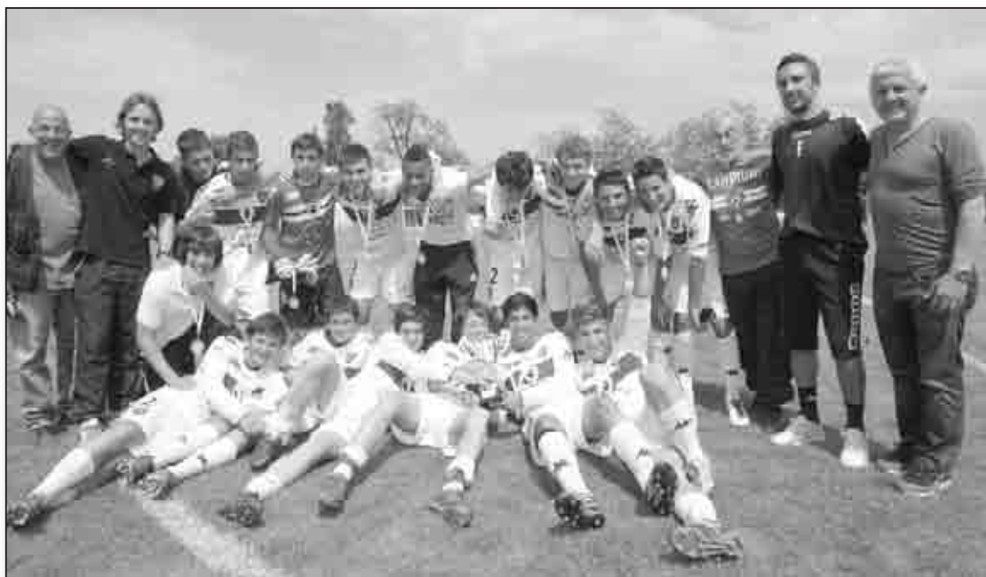
Les joueurs et le staff du SCB savourent leur succès