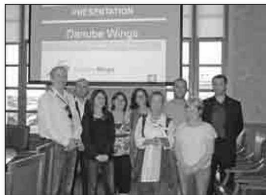
Les agents de voyages invités à découvrir une nouvelle offre aérienne